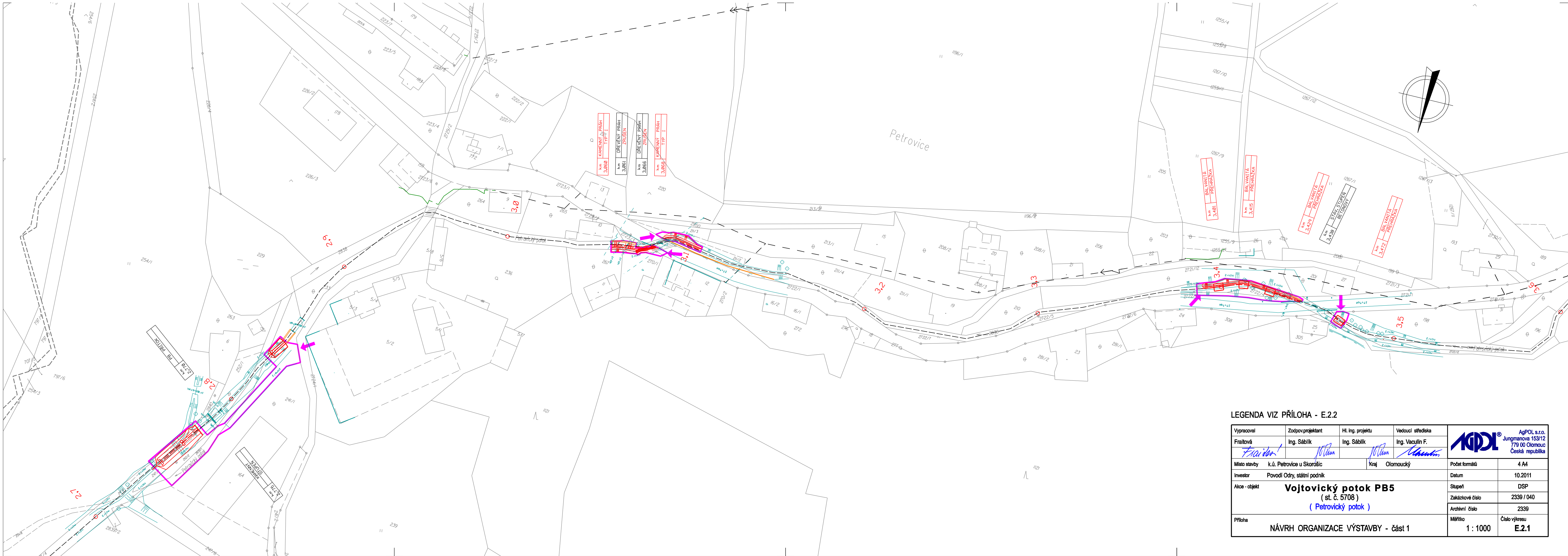
LEGENDA VIZ PŘÍLOHA - E.2.2